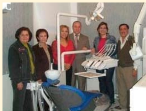
Medlemmar i Rotary Club of Sahel Aley och Ladies League of Chowiefat lämnar över utrustning till tandklinik som erbjuder gratis tandvård i Chowiefat i Libanon.

Omkring 75 procent av de 150 000 människor som bor i Chowiefat i Libanon och omgivande städer är fattiga eller har inkomster som är under genomsnittet. Ett medicinskt center som etable-