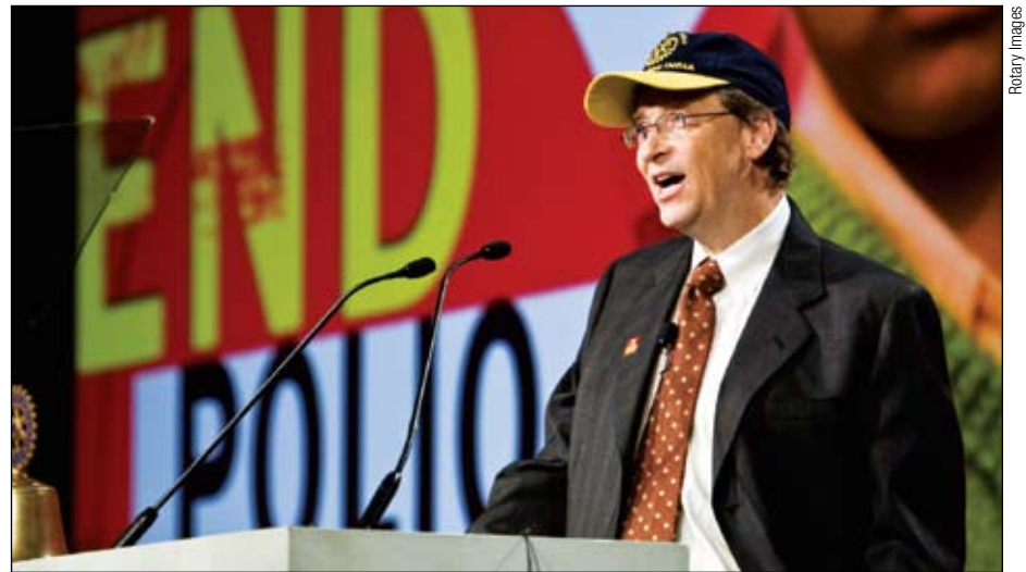
Bill Gates fala durante a assembleia internacional de 2009.

Em 2008 foram arrecadados US$61 milhões em contribuições e US$11 milhões em termos de compromisso. O sucesso do Desafio 200 Milhões de Dólares do Rotary dependerá da participação dos rotarianos. Os clubes estão sendo de-