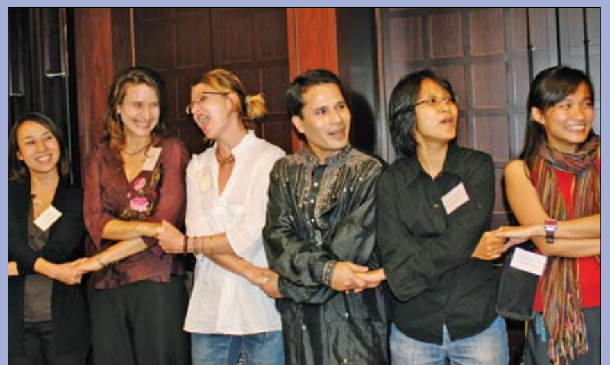
Bolsistas e ex-bolsistas do Rotary e do programa de Bolsas Rotary Pela Paz Mundial dançam e cantam em Tóquio. O evento é organizado anualmente pela associação de ex-participantes de programas da Fundação Rotária de Tóquio.