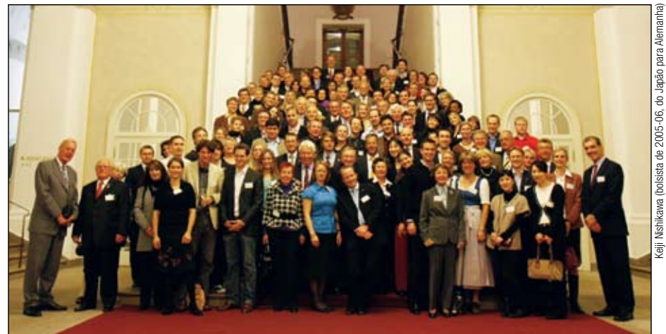
Ex-participantes de programas da Fundação se reúnem em Munique para comemorar o 10º aniversário da RFAD.

"Todos acharam o programa divertido e informativo", disse Wente.