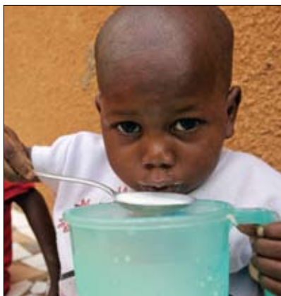
Uma criança recebe mingau fortificado com nutrientes essenciais na clínica de Koure.

mais novas, especialmente aquelas com menos de dois anos de idade. A ciência hoje comprova que as crianças jamais conseguem compensar a falta de nutrição adequada verificada no período de gestação até os dois anos de idade. O desenvolvimento físico e mental fica comprometido por toda a vida. Sendo assim, muito embora o Objetivo de Desenvolvimento do Milênio tenha como foco melhorar a nutrição dos menores de cinco anos, sabemos que o período propício é até os dois anos de idade. Sabemos também que as sociedades pagam um preço muito alto pela queda do potencial humano, perdendo mais de 10% do PIB nacional por causa da subnutrição. O REACH visa ajudar os países a identificar intervenções essenciais e comprovadamente eficazes que possam beneficiar mães e crianças de até dois anos de idade a curto prazo, e visa também reunir todos os parceiros através de uma única meta e estratégia para estender essas intervenções a todas as crianças, dando a elas uma base nutricional adequada que venha a favorecê-las por toda a vida.