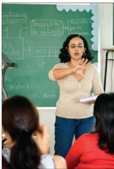
Com o apoio do Rotary, o método CLE foi ensinado a mais de 2.000 professores brasileiros.

Um método revolucionário desenvolvido por rotarianos foi usado para ensinar milhares de pessoas a ler e escrever