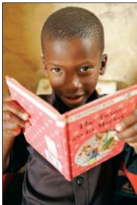
Na África do Sul, programas rotários de alfabetização beneficiam pessoas de todas as idades, tanto de áreas rurais quanto urbanas.

a compreender a importância de ler para seus filhos desde a mais tenra idade. Com este objetivo, o Rotary Club de Auburn, EUA, criou os livros Babies Love Books , que o clube e um centro médico de bairro de baixa renda distribuem aos pais de recém-nascidos.