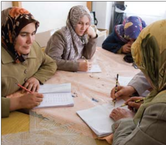
Um programa rotário CLE na Turquia tem enfoque em ensinar a mulheres habilidades básicas de leitura

No treinamento profissional do projeto, estudantes participam de um curso de quatro