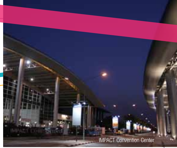
IMPACT Convention Center

99 Popular Road, Banmai Subdistrict, Pakkred District, Nonthaburi 11120, Thailand 아시아 최대의 컨벤션 센터의 하나인 Impact Center 에서 본회의, 우정의 집, 전시회 그리고 RI 관련 공식회합이 개최된다. 방콕 중심가에서 약 30분 거리에 위치하고 있으며, 특별 오찬이 열리는 Royal Jubilee Ballroom을 비롯한 현대적인 시설을 자랑하고 있다.