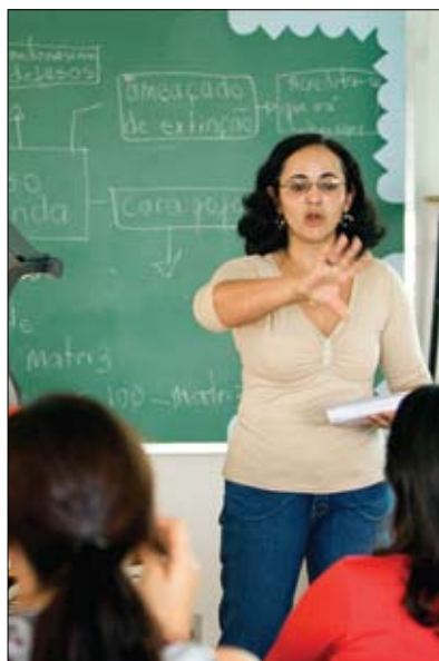
Con il sostegno del Rotary oltre 2,000 insegnanti Brasiliani hanno appreso il metodo CLE.

Leggete un articolo extra sul Web a proposito dello sviluppo dei programmi di alfabetizzazione del Rotary trovando anche collegamenti con Comunità all'opera. Una selezione di opportunità di servizio (605C-IT) e altri dati sul Rotary e l'alfabetizzazione.