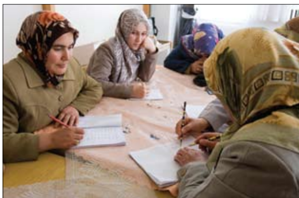
Un programma CLE sponsorizzato dal Rotary in Turchia.