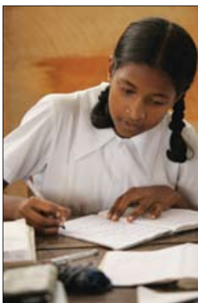
I progetti di alfabetizzazione del Rotary hanno dato la necessaria spinta alle scuole dello Sri Lanka.

23,6 per cento nel Burkina Faso, in Africa occidentale ad oltre il 99 per cento in Nord America, Europa e una gran parte di ex repubbliche sovietiche e loro alleati. Ma