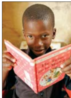
In Sud Africa, i programmi di alfabetizzazione del Rotary toccano persone di tutte le età in aree urbane e rurali.

Le difficoltà educative possono cominciare nell'infanzia e, per aiutare i genitori a capire l'importanza della lettura ai bambini sin dalla nascita, il Rotary Club di Auburn, Alabama, USA, ha sviluppato il programma Babies