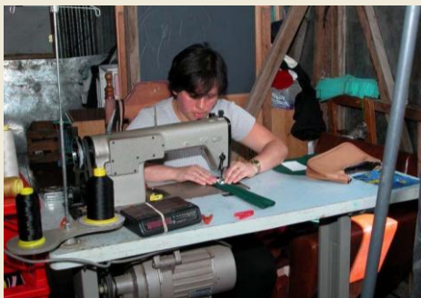
Soluzioni di microcredito