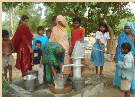
Acqua e strutture igienico-sanitarie