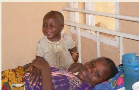
Salute materna e infantile