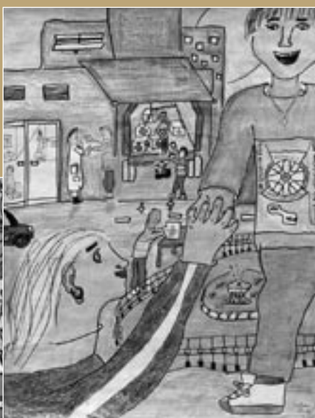
Vous pouvez admirer ici les affiches de trois des lauréats de zone (de haut en bas) : zone 19 (Amérique du Sud), zone 7 (Pacifique Sud) et zone 4 (Asie).