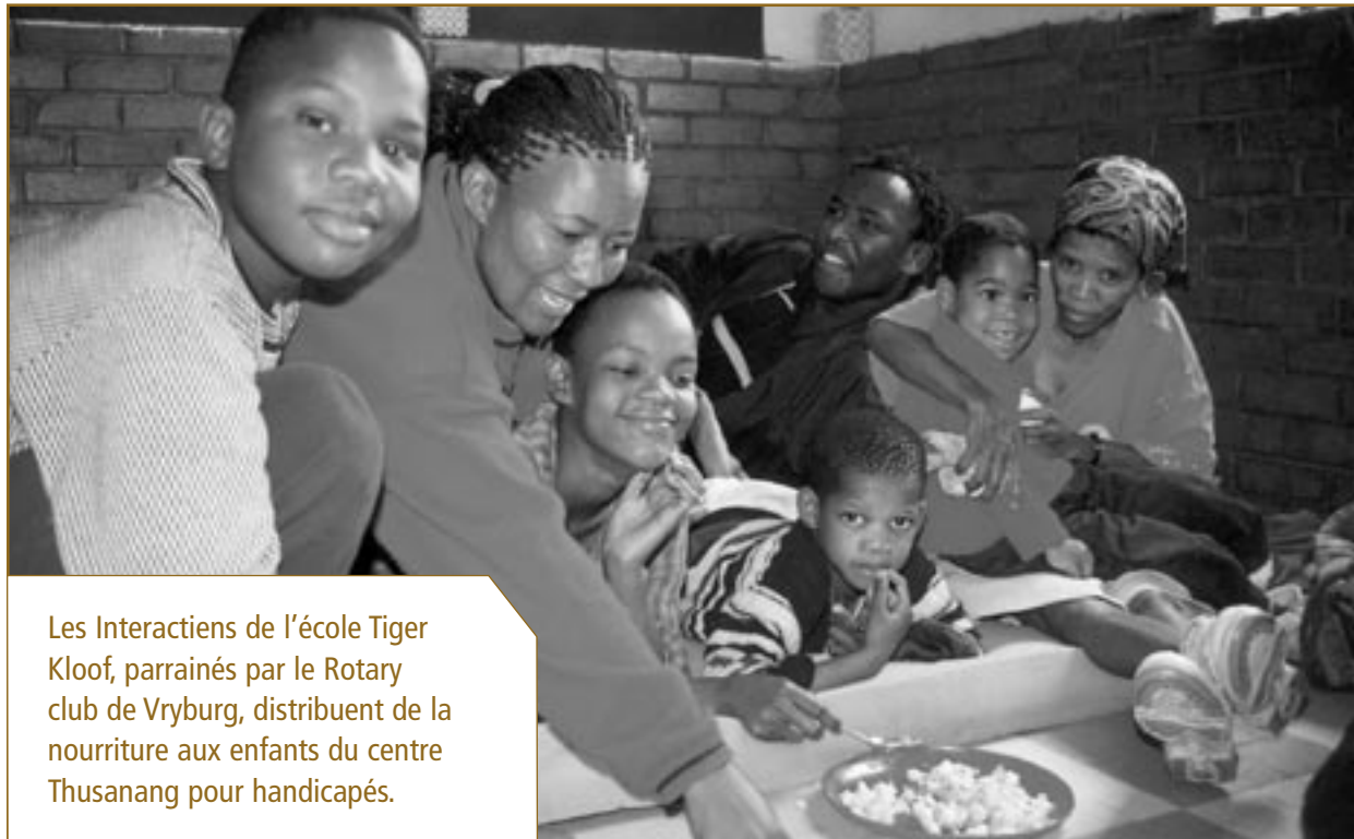
Les Interactions de l'école Tiger Kloof, parrainés par le Rotary club de Vryburg, distribuent de la nourriture aux enfants du centre Thusanang pour handicapés.

Aujourd'hui, les deux clubs sont devenus des clubs contacts et continuent de travailler ensemble au rapprochement des diverses communautés de la ville. Ils viennent par exemple d'obtenir deux subventions de contrepartie, la première pour équiper un centre d'alphabétisation pour adultes, la seconde pour un centre pour handicapés.