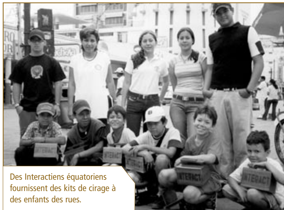
Des Interactiens équatoriens fournissent des kits de cirage à des enfants des rues.

Chaque année, les Rotariens et Interactiens célèbrent la création du premier club Interact dans le cadre d'activités conjointes lors de la semaine mondiale de l'Interact qui aura lieu cette année du 1 er au 7 novembre. Pour en savoir plus, cliquez sur les pages "Programs" sur le site du Rotary ( www.rotary.org ).