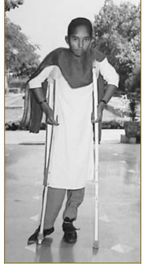
Grâce à une opération suivie de physiothérapie, cette jeune fille pourra un jour marcher sans béquilles.

Cette action fut l'une des 70 à recevoir par le Prix pour réalisations marquantes du Rotary l'an dernier. Ce prix