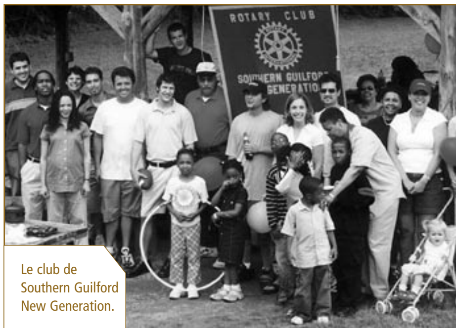
Le club de Southern Guilford New Generation.