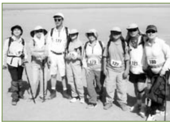
Une course dans le Gobi, un des moyens originaux de collecter des fonds pour l'Initiative d'entraide PolioPlus (PolioPlus Partners)

Pour en savoir plus sur l'Initiative d'entraide PolioPlus ou obtenir une liste des actions en cours (Open Projects List), se rendre à www.rotary.org ou contacter le +1 847 866 3255 (tél.) ; par fax, le +1 847 866 0269 ou envoyer un mail à polioplus@rotaryintl.org .