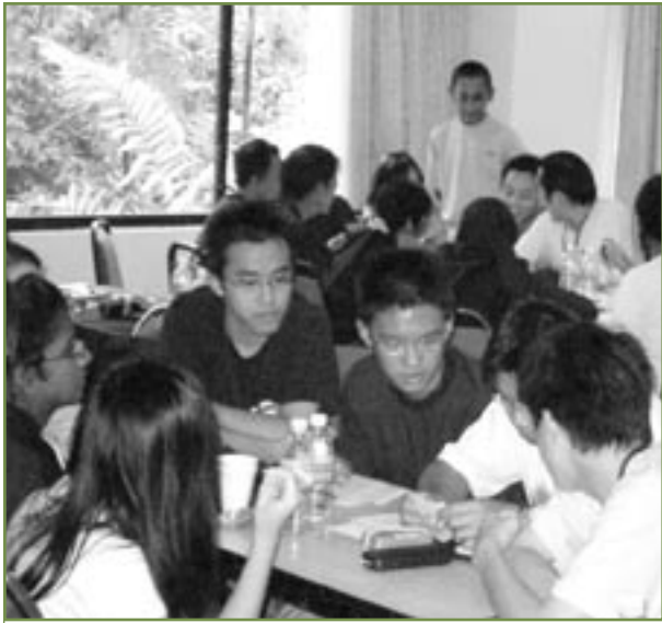
Jeunes participants à un camp RYLA organisé en Malaisie avec l'aide du cyber-club du district 3310