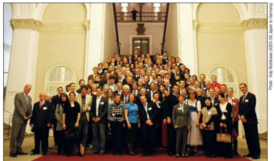
Des Anciens réunis à Munich pour célébrer le 10 e anniversaire de l'association allemande des Anciens de la Fondation Rotary.