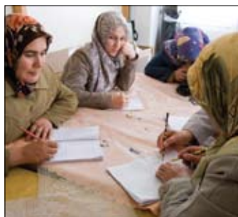
En Turquie, un programme C.L.E. parrainé par le Rotary permet aux femmes d'acquérir une éducation de base.