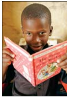
Dans les zones rurales et urbaines d'Afrique du Sud, les programmes d'alphabétisation du Rotary touchent toutes les tranches d'âge.

riens du club d'Auburn (États-Unis) ont lancé le programme Babies Love Books (Les bébés aiment la lecture) pour sensibiliser les parents à l'im-