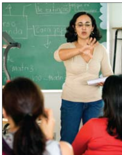
Avec le soutien du Rotary, plus de 2 000 enseignants brésiliens ont pu apprendre la méthode C.L.E.

Une méthode révolutionnaire mise au point par des Rotariens a permis d'apprendre à lire à des centaines de milliers de personnes