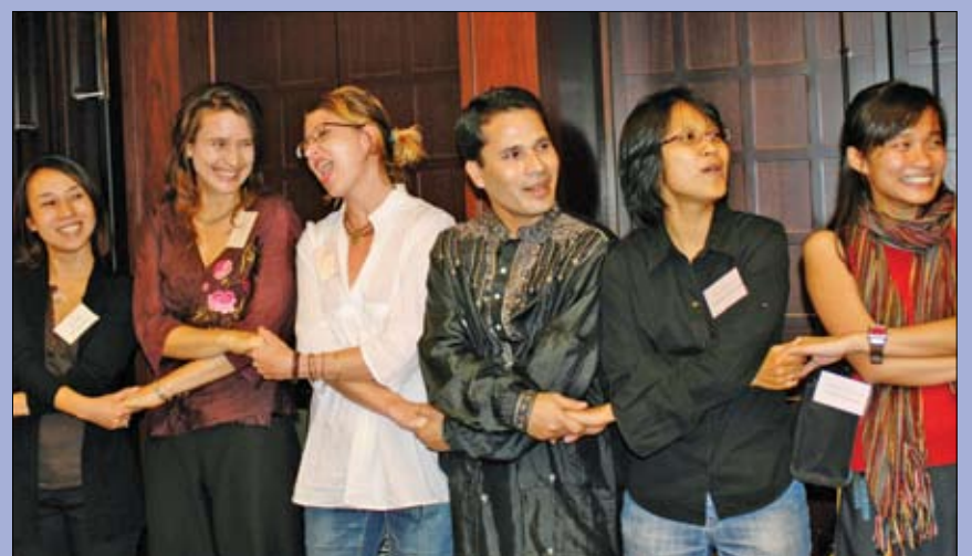
Becarios y ex becarios de Buena Voluntad y Rotary pro Paz Mundial disfrutaron de una velada internacional de baile y canto durante el evento anual que organiza la Asociación de ex Becarios de Rotary de Tokio.