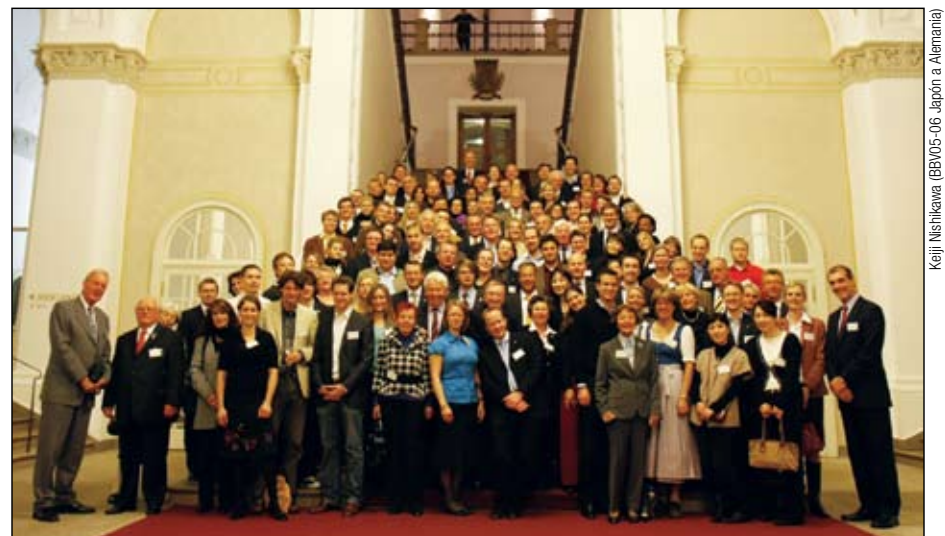
Ex becarios se reúnen en Munich en ocasión del 10º aniversario de la Rotary Foundation Alumni Deutschland.

En el último día de actividades, visitaron la exhibición "El maravilloso mundo de Walt Disney y sus raíces en el arte europeo" en el Kunsthalle der Hypo-Kulturstiftung de Munich, y culminaron la celebración en una cervecería-restaurante en la Torre China.