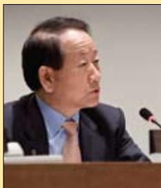
El presidente Lee habla sobre su iniciativa para disminuir la mortalidad infantil durante el Día de Rotary International en la ONU, celebrado en 2008.

El lema y las iniciativas de servicio de este año brindan al 1,2 millones de rotarios la oportunidad de centrar su labor en una área específica en la cual puedan ejercer una influencia genuina y duradera.