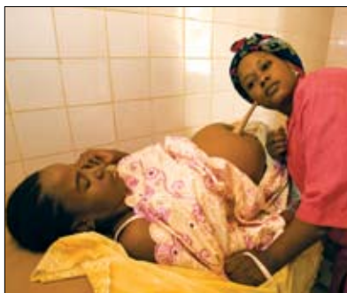
Durch die Unterstützung von Rotariern erhalten werdende Mütter im Krankenhaus von Koure die Gesundheitsfürsorge, die sie benötigen.

Mutter auf das Kind – einer der häufigsten Todesursachen unter jungen Afrikanern – zu verhindern. AIDS ist nicht nur der Grund dafür, dass eine ganze Generation afrikanischer Kinder allein ohne Mutter aufwachsen muss, die überlebenden Babys werden zudem in Kinderheime gebracht, in denen sie schlimmsten Verhältnissen ausgesetzt sind, die ein Todesrisiko mindestens verdoppeln.