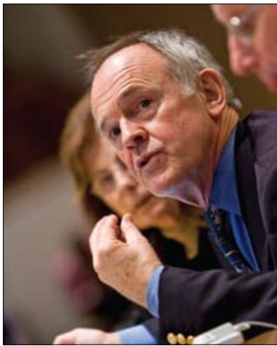
Darnton-Hill von UNICEF spricht von der Beendigung des Hungers bei Kindern auf dem Rotary International Day bei den Vereinten Nationen 2008.

nicht nur darum, Ärzte und Kliniken zu haben“, sagt er. „Wir müssen auch Versorger auf einer anderen Ebene ausbilden, keine Ärzte oder Krankenschwestern, sondern Personen, die darin geschult werden, Antibiotika zu verabreichen und die nahe bei den Kindern leben.“ Er führt die zwei Haupttodesursachen für Kinder an, die so leicht zu bekämpfen wären: Lungenentzündung (durch eine schnelle Verabreichung von Antibiotika) und Durchfallerkrankungen (durch eine schnelle Rehydrations-Therapie).