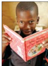
In Südafrika verändern rotarische Alphabetisierungsprogramme das Leben der Menschen aller Altersgruppen in Stadt und Land.

es ist, ihren Kindern von Geburt an vorzulesen, entwickelte der Rotary Club Auburn in Alabama (USA) das Projekt „Babies Love Books“ (Babys lieben Bücher). In Zusammenarbeit