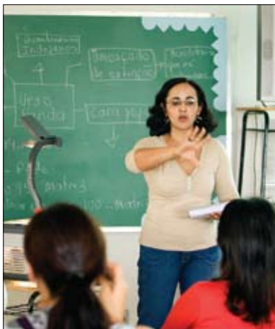
Mit Rotarys Hilfe wurden über 2.000 brasilianische Lehrer in der CLE-Methode ausgebildet.

Bei Kindern fördert die Fähigkeit, lesen zu können, ein gesundes Selbstbewusstsein. Für Teenager bedeutet sie, dass sie die Schule abschließen können. Und für Erwachsene ist die