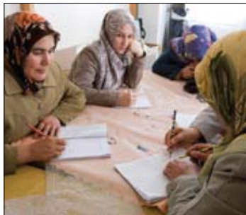
Ein von Rotary gesponsertes CLE-Programm in der Türkei vermittelt erwachsenen Frauen grundlegende Lese- und Schreibkenntnisse.

Untersuchungen in Entwicklungsländern haben gezeigt, dass selbst geringe Schulbildung von Frauen (ein bis drei Jahre) die Kindersterblichkeit verringern kann. Eine Studie in Bangladesch ergab, dass das Kind einer Frau mit Grundschulausbildung eine 20 Prozent höhere Überle-