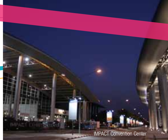
IMPACT Convention Center

Neue elektronische Ausweiskarten erlauben den Anwesenden einen leichteren und bequemerem Zugang zu den RI Veranstaltungen, für die sie sich angemeldet haben.